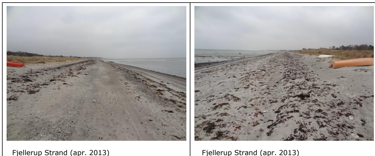
Fjellerup Strand (apr. 2013)